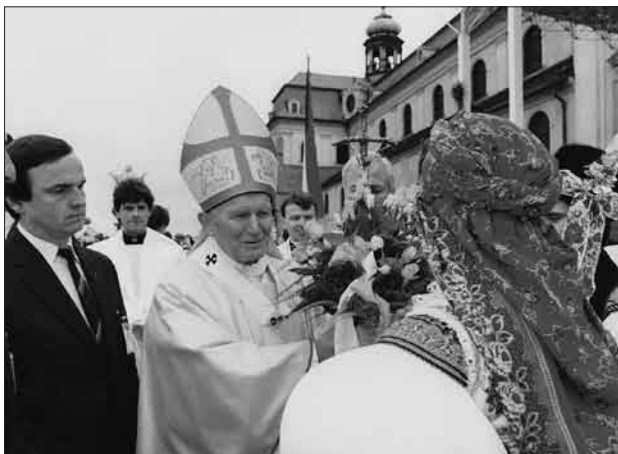
Papež Jan Pavel II. na Velehradě v roce 1990